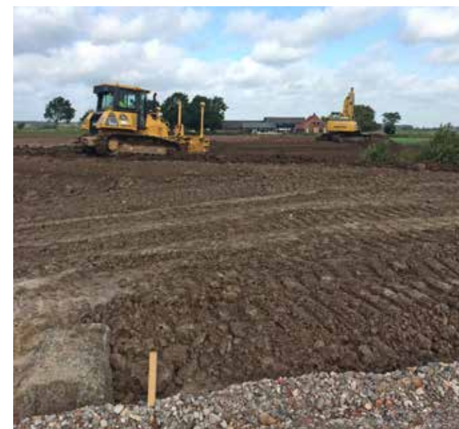
De Slaagse Dijk bij Krachtwijk wordt afgewerkt.